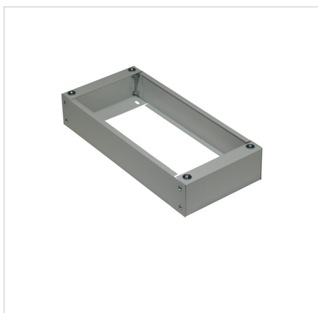
WIDOK COKOŁU DO RWX