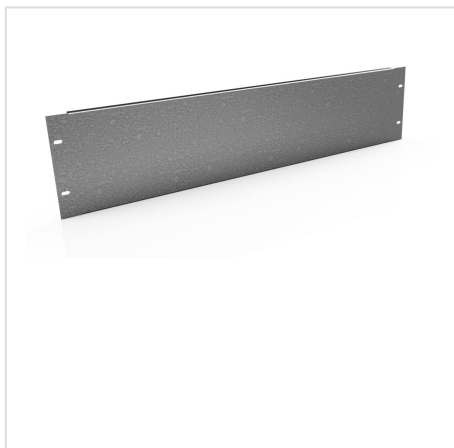
PUA płyta montażowa uniwersalna