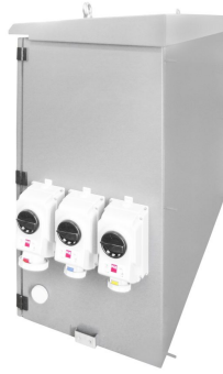
PRZYKŁADOWA REALIZACJA EXEMPLARY OF IMPLEMENTATION