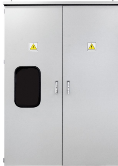
PRZYKŁADOWA REALIZACJA EXEMPLARY OF IMPLEMENTATION