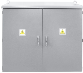
PRZYKŁADOWA REALIZACJA EXEMPLARY OF IMPLEMENTATION