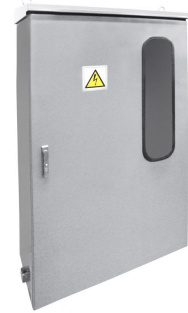
PRZYKŁADOWA REALIZACJA EXEMPLARY OF IMPLEMENTATION