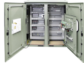
PRZYKŁADOWA REALIZACJA EXEMPLARY OF IMPLEMENTATION