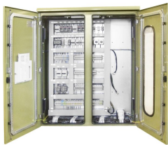
PRZYKŁADOWA REALIZACJA EXEMPLARY OF IMPLEMENTATION