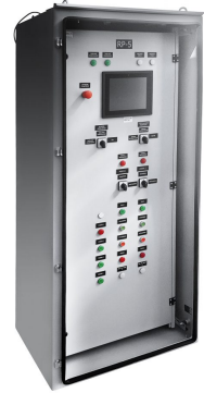
PRZYKŁADOWA REALIZACJA EXEMPLARY OF IMPLEMENTATION