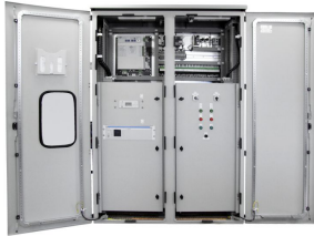
PRZYKŁADOWA REALIZACJA EXEMPLARY OF IMPLEMENTATION