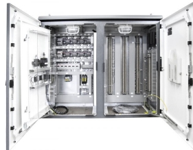
PRZYKŁADOWA REALIZACJA EXEMPLARY OF IMPLEMENTATION