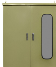
PRZYKŁADOWA REALIZACJA EXEMPLARY OF IMPLEMENTATION