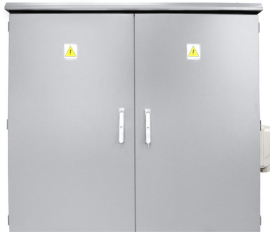
PRZYKŁADOWA REALIZACJA EXEMPLARY OF IMPLEMENTATION